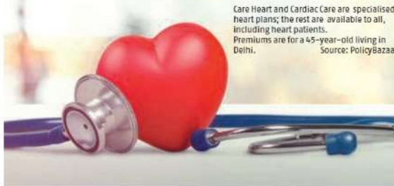
Care Heart and Cardiac Care are specialised heart plans; the rest are available to all, including heart patients. Premiums are for a 45-year-old living in Delhi.